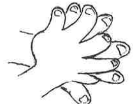
3. 手の平と手の甲 (交互)