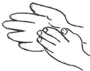
4. 指をそろえ、指先と手の平 (交互)