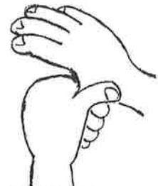
6. 親指をもう片方の手で包みこんで (交互)