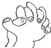
2. 指を組んで、手の平と手の平 (交互)