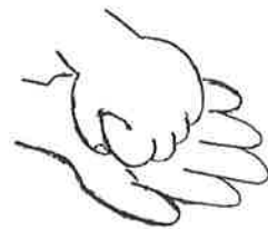
5. 指を曲げ、指の背と手の平 (交互)